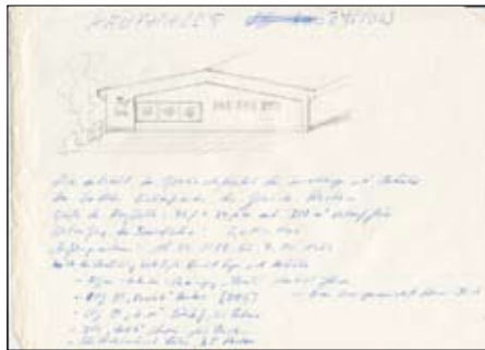
Eine Skizze, von Christian Blunck angefertigt, als Vorlage für das Baustellenschild

Zusätzlich musste vom Landbaukombinat Ludwigslust ein Projekt gekauft werden, das für eine ähnliche Kaufhalle in Neustadt-Glewe angefertigt wurde. Hierin war die Elektro- und Sanitärinstallation, insbesondere aber auch die geänderte Dachform beschrieben. Das Projekt sah eine Dacheindeckung mit Bitumendachpappe und Preolitschindeln vor. Abweichend hierzu sollte die Dacheindeckung mit Eternit, wie man damals schon die weit verbreiteten Wellasbestplatten nannte, ausgeführt werden. Hierzu musste aber eine Sondergenehmigung eingeholt werden.