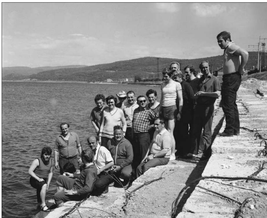
Die Begleiter des Viehtransportes am Ufer des Baikalsees

In der DDR war der Export von Zucht- Nutz- und Schlachtvieh neben der Versorgung der Bevölkerung eine sehr dringliche Aufgabe der Landwirtschaft. Gab es doch für diese Exporte harte Valuta, die der Außenhandel dringend benötigte.