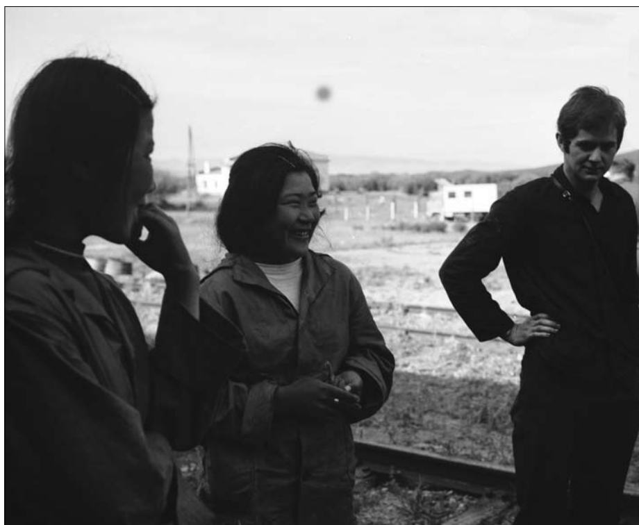
Fachgespräche am Rande der Übergabe

Fahnen beider Länder werden gehisst, mongolische Hirten hielten die übermütigen Färsen zusammen. Festlich gekleidete Männer und Frauen, ja ganze Familien waren zum Empfang gekommen. Das Fernsehen machte Aufnahmen von dem außergewöhnlichen Ereignis. Ganz ist das Ziel jedoch noch nicht erreicht. Noch 80 km Fussmarsch sind bis zum Stall zu absolvieren. Die robusten „Schwarzbunten“ schaffen auch dies. Alle Rinder