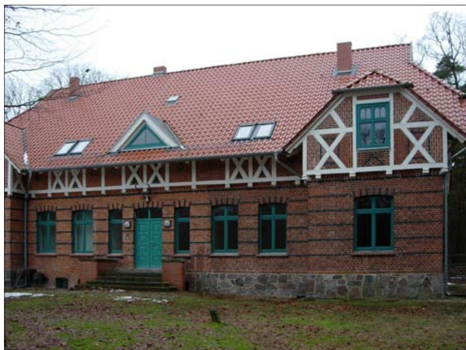
Forsthof Kraaker Mühle