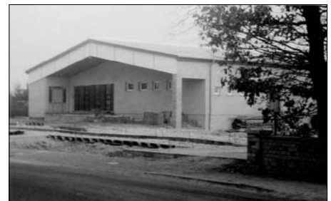
Bauplan (unten) und Rohbau (oben) des Einkaufszentrums in Rastow

Um der Planvorgabe einigermaßen gerecht zu werden, wurde die Bauübergabe vom Investitionsauftraggeber LPG Rastow an die Konsumgenossenschaft Ende Dezember 1989 durchgeführt. Man legte die Orientierungstermine für die Fertigstellung auf den 01.04.1990, und die Eröffnung auf den 01.05.1990.