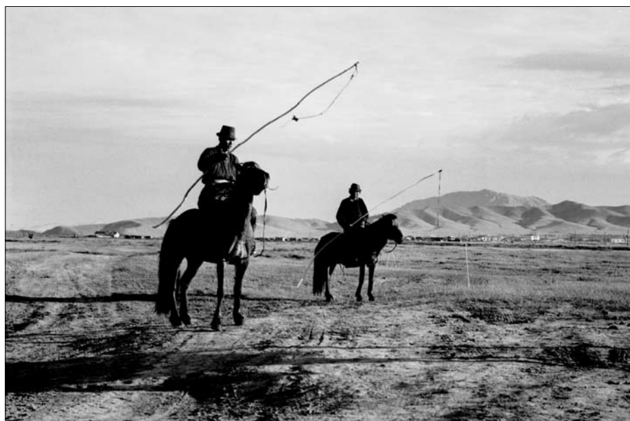
Mongolische Hirten am Entladeort in der Steppe

Im Morgengrauen des nächsten Tages hält der Zug mitten in der Steppe. Es wird ausgeladen, Mensch und Tier haben ihr vorläufiges Ziel erreicht.