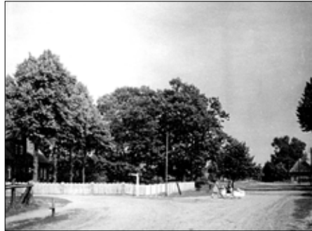
Rastow ca. 1941

regelmäßig von den Gehöften zum Wasser. Und so manches Mal war es abends recht schwierig, das Wassergeflügel vom Wasser in den Stall zu bekommen.