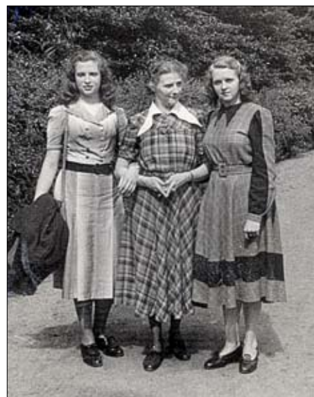
1948, alle drei Kleider haben jetzt die von der Mode „vorgeschriebene“ Länge.

Die Mode! 1948 tauchte er auf, der NEW LOOK. Die Kleider mussten nun länger werden. Jetzt wurden Stoffreste zusammengesucht, zugeschnitten und damit die Röcke verändert. Sah gar nicht mal so übel aus! Damals war viel Fantasie gefragt, und meist mit Erfolg!