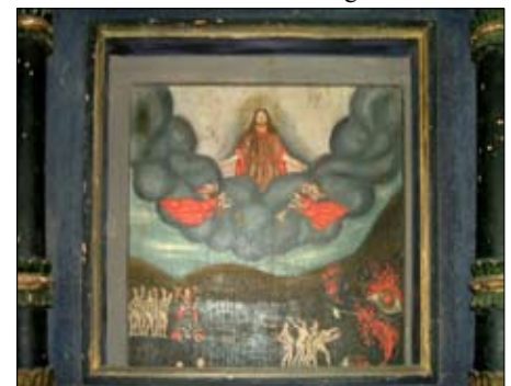
... mit Ausschnitt „Höllenschlund“