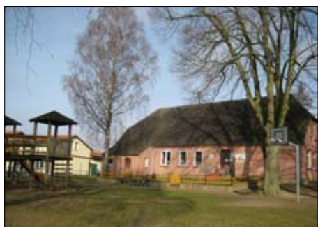
Kitaspielplatz „Spatzennest“ in Lüblow

Das Team Wandern der Interessengemeinschaft Kultur der Gemeinde Rastow lädt herzlich ein zur nächsten Wanderung „Auf den Spuren der Johanniter“ mit kulturhistorischen Erklärungen am Samstag, 17.05.2008