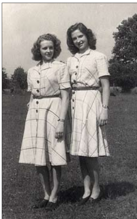
Zwei Kleider aus Vorhangstoff gefertigt. Die Knöpfe konnten noch bei Voss gekauft werden.

ganz Besonderes: die Stores aus unserem Hamburger Esszimmer wurden schwarz gefärbt (womit weiß ich nicht mehr) und mit einer alten rosa Bluse unserer Mutti entstand daraus ein ganz toll schickes Kleid zum Ausgehen und Tanzen. Für das Tägliche konnten Vorhänge aus unserem Kinderzimmer zerschnitten und zu zwei