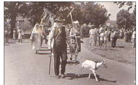
Festumzug in Fahrbinde 1983

Die Gaststätte und den Saal gibt es nun schon einige Jahre nicht mehr, was Anlass war, die Festlichkeiten in ein Festzelt zu verlegen. Mit Sport, Spiel und Blasmusik, dazu eine Kaffeetafel mit leckerem Kuchen – gebacken von vielen Hobbybäckerinnen – wird der Nachmittag verbracht. Abends treffen sich alle zum Tanz unter