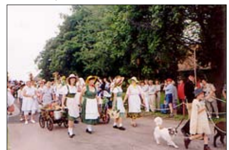
Festumzug in Fahrbinde 1983

K neben den regelmäßig stattfindenden Ausstellungen in der Galerie veranstalten wir verstärkt Workshops zu künstlerischen Techniken, Kurse und Seminare für das Gestalten aussagefähiger Dokumentationen , Festzeitungen für besondere Anlässe, Präsentationen und Broschüren sowie Bewerbungsunterlagen auf der Basis der auf Ihrem PC-üblichen Programme und wir entwickeln mit unserem know-how vom Konzept bis zur Fertigstellung Ihr gesamtes werbliches Erscheinungsbild