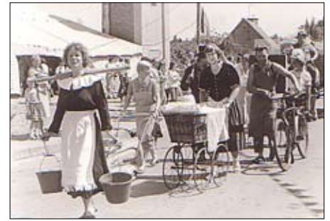
Festumzug in Fahrbinde 1983

In Zusammenarbeit mit der Ortsteilvertretung und dem örtlichen Dorf- und