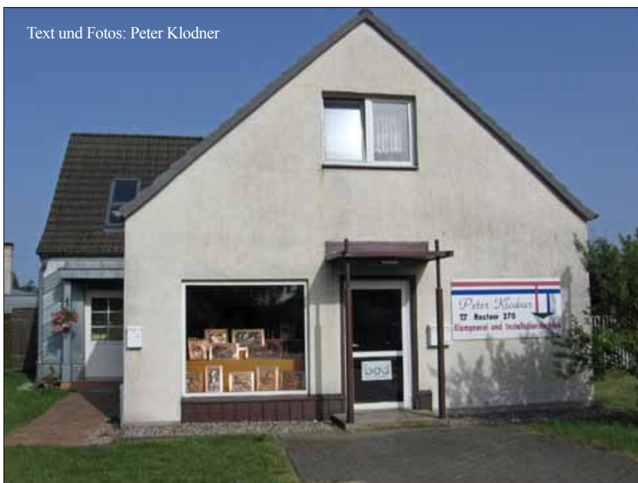
Text und Fotos: Peter Klodner

Erzählen Sie uns Ihre Erlebnisse aus dem Leben in Rastow. Finden Sie alte Fotos oder Tagebücher und teilen Sie uns die Geschichte dazu mit.