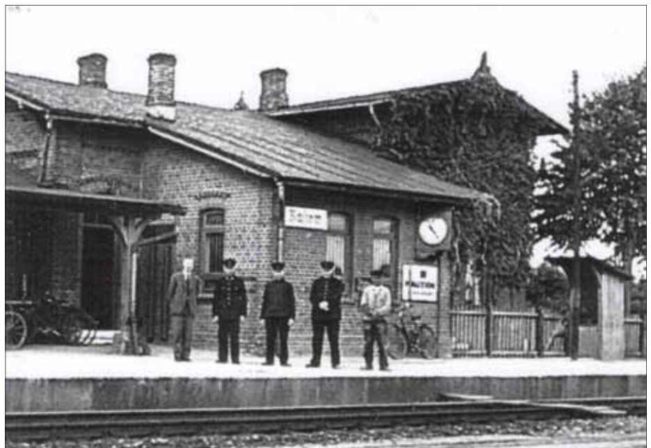
Der Rastower Bahnhof mit Bahnpersonal 1941

Viel aufregender war der Teil des Bahnhofs, der unsere kindliche Phantasie enorm beschäftigte. Das war die Verladerrampe mit den Viehboxen und der anschließenden Verladestation für Holz. In besseren Tagen trieben die Bauern das verkaufte Vieh bis zum Abtransport zum Schlachthof hier hinein. Wir Kinder konnten uns dort verstecken, über Umzäunungen klettern, die „Gegner“ in Boxen einsperren; wir konnten ganz einfach herrlich spielen.