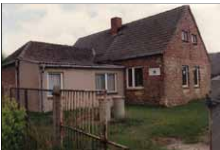
Einst und heute

Firmenschild stand nun: „Klempnerei und Installationsbetrieb Peter Klodner“. Nach fast 35 Jahren Holzwerkstatt wurden in den Räumen ab jetzt Bleche bearbeitet und Material für Bäder zwischengelagert. Ein knappes Jahr später wurde das Walmdach des Eingangsbereiches gegen ein Satteldach ersetzt. Gleichzeitig bekamen das Haupthaus eine neue Dacheindeckung und der straßenseitige Anbau einen Strukturputz. Durch das höhere Satteldach wurde die Möglichkeit eines Dachgeschossausbaus geschaffen und im Jahre 1996 realisiert. Drei Wohnräume, Küche und Badezimmer entstanden dort, wo einst Leisten und Furniere lagerten. Und dort, wo früher Sägen kreischten, werden jetzt fast lautlos Bleche verformt. Von den 20 Jahren des Bestehens meiner Firma spielen sich bereits 19 Jahre in diesen Räumen ab.