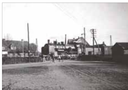
Die Bahnschranken - ein Zug fährt durch

Direkt nach 1945 waren wir darauf spezialisiert, auf langsam fahrende Güterzüge, die mit Kohlen beladen waren, aufzuspringen. Dann musste man in größter Eile einige wenige Briketts abwerfen und schnell einsammeln. Zu Hause wurde ob dieses nicht ungefährlichen Tuns nicht geschimpft, es zählte nur das erbeutete Heizmaterial!